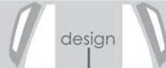
T-TOP - Configurazione APERTA