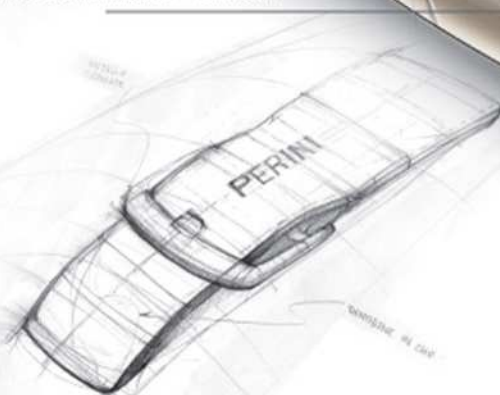
DETTAGLIO TIENTIBENE - "CINTURA"